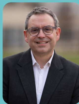
Philippe RIO Président de la coopérative des élus communistes, républicains et citoyens, Maire de Grigny