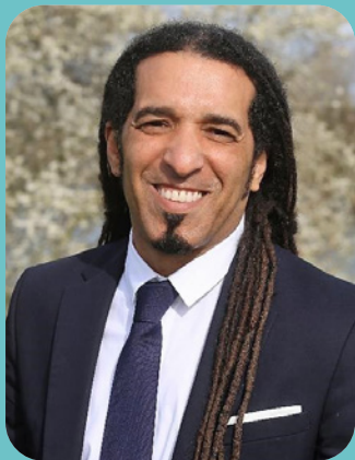
Steevy GUSTAVE Député de la 3 ème circonscription